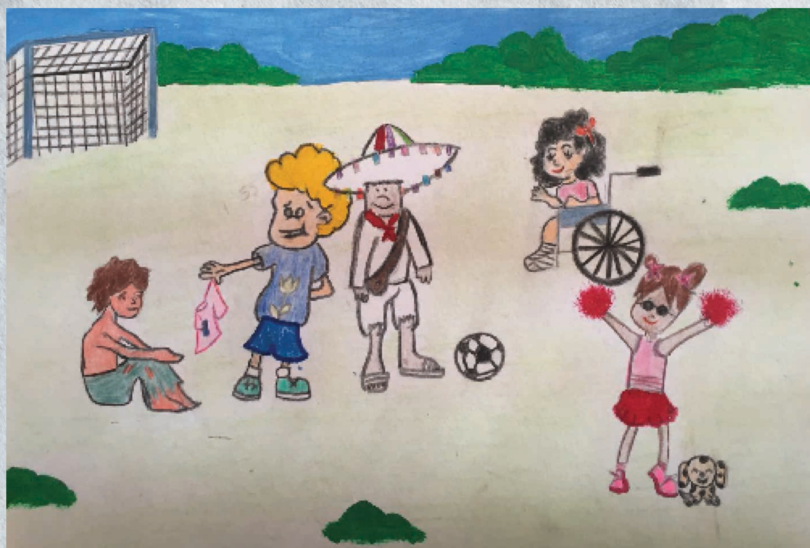
Ewin Misael, primer lugar de la categoría "A" del XIII concurso de dibujo.

Se llaman "derechos humanos" porque los tienen todas las personas del planeta sin importar su edad, su aspecto o el lugar donde viven.